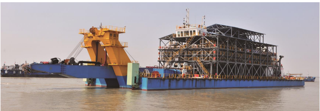
Exemplo de barco de mineração utilizado na mineração de areias pesadas

Para a extracção e separação dos minerais será utilizado um barco de mineração, composto por duas divisões principais: a divisão da draga e a divisão da separação.